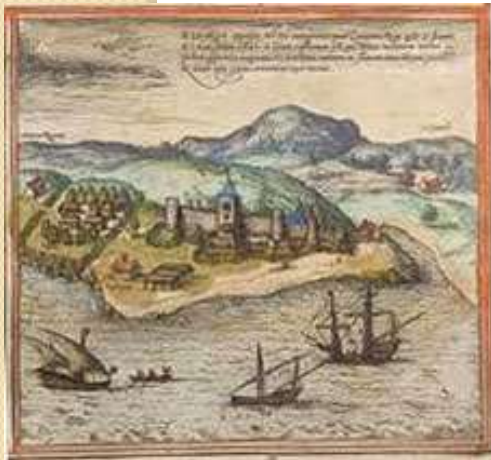
Mina, forte in Ghana