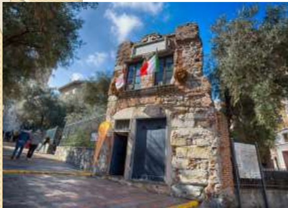
Casa di Colombo a Genova