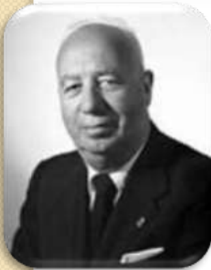
Paolo Emilio Taviani